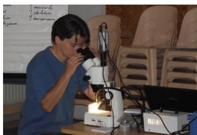
Identification délicate...