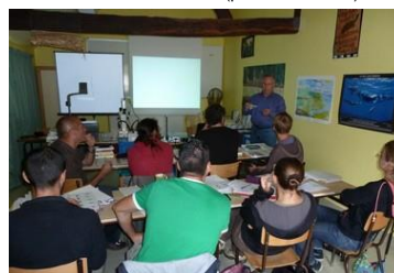
Cours en salle