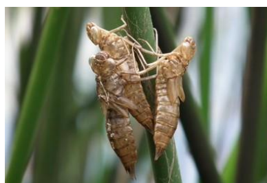
Reconnaissance des exuvies (J.-L. D.)