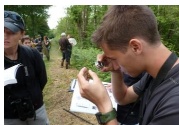
Identification in situ