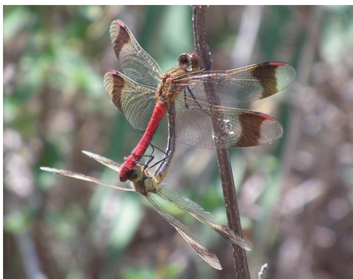
Reconnaissance des adultes