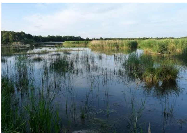
Caractéristiques essentielles des habitats larvaires